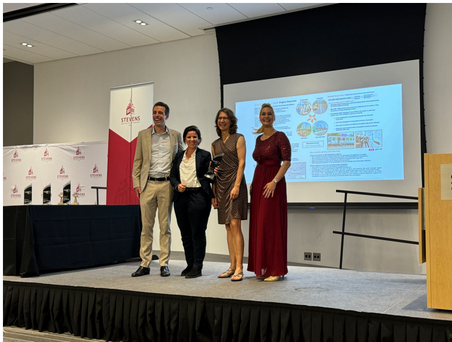
Die Verleihung am „Stevens Institute of Technology“ in Hoboken, New Jersey.

Ein wichtiger Teil der Konferenz sind die Vorträge von Expert:innen über Best-Practice-Beispiele aus aller Welt: vom Bau einer innovativen Lebensmittelfabrik mit Solarenergie in Malaysia über komplexe Bauprojekte in New York, London und Schweden bis hin zum Brückenbau in Uganda, durchgeführt von Ingenieuren ohne Grenzen. Von diesen Kontakten werden wir gemeinsam mit den beiden Ländern Hamburg und Schleswig-Holstein in hohem Maße profitieren. Der ICPMA Award motiviert uns für die kommenden Aufgaben und wird uns Rückenwind geben. Mehr zum ICPMA Award hier .