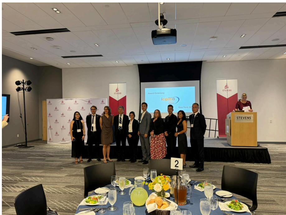
Die S4 ist nun Teil eines internationalen Netzwerks: Die Gewinner:innen der Awards aus verschiedensten Ländern und Projekten.

Ein wichtiger Teil der Konferenz sind die Vorträge von Expert:innen über Best-Practice-Beispiele aus aller Welt: vom Bau einer innovativen Lebensmittelfabrik mit Solarenergie in Malaysia über komplexe Bauprojekte in New York, London und Schweden bis hin zum Brückenbau in Uganda, durchgeführt von Ingenieuren ohne Grenzen. Von diesen Kontakten werden wir gemeinsam mit den beiden Ländern Hamburg und Schleswig-Holstein in hohem Maße profitieren. Der ICPMA Award motiviert uns für die kommenden Aufgaben und wird uns Rückenwind geben. Mehr zum ICPMA Award hier .